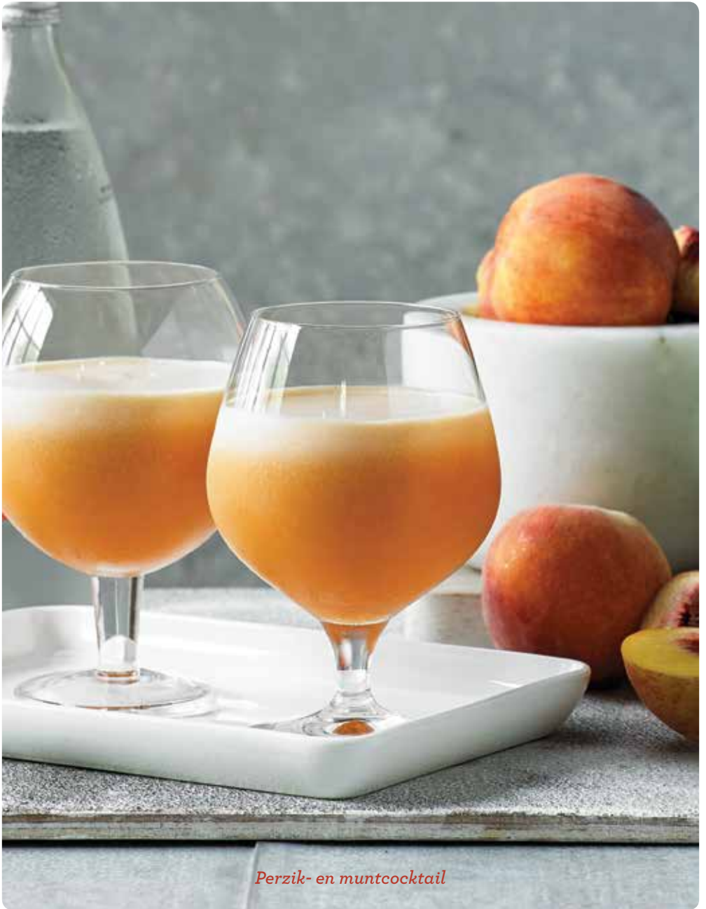
Perzik- en muntcocktail