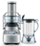
the 3X Bluiser Pro™