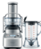
the 3X Bljuicer Pro™

350 g bevroren mango, in stukken gesneden 120 g (ongeveer 6) ijsblokjes 5 g (ongeveer 15) verse muntblaadjes 190 g (ongeveer 2) geschilde limoenen 760 g (ongeveer 5) geschilde sinaasappels Pulp van 2 passievruchten