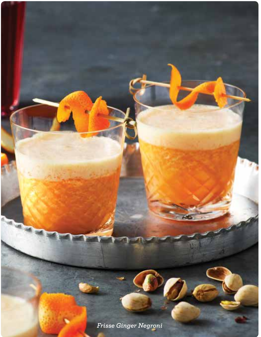
Frissé Ginger Negroni