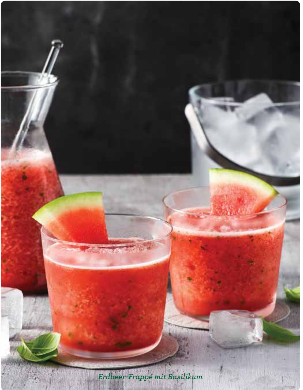
Erdbeer-Frappé mit Basilikum