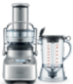
the 3X Blucifer Pro™